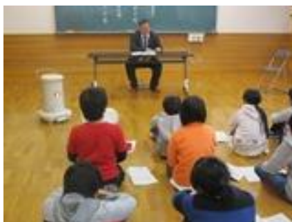
▲避難所体験③ 地域の方による「新潟地震体験談」の講話

村上市地域振興課総務管理室長より「災害時の避難の仕方、避難所の開設」 についての講話