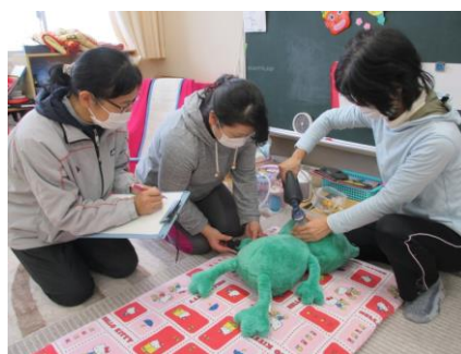
▲保護者引き渡し訓練。